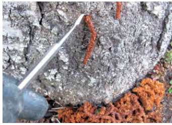
幼虫が摂食したフラスの堆積