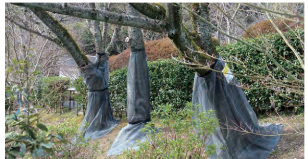
景観に馴染みやすく樹木にマッチするブラック色

被害樹木の根元には、幼虫が食い荒らしたフラスが大量に排出されるので早期発見対策を施し、周辺の未被害樹木にも産卵防止のためのネット装着を推奨。クビアカツヤカミキリは、繁殖力が強く今後の被害の拡大が懸念されており、昼行性で日中に活発な行動をするので、発見した際には即刻補殺することにより、被害の軽減が図れます。