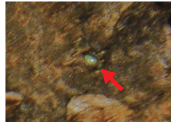
樹皮の窪みに産卵