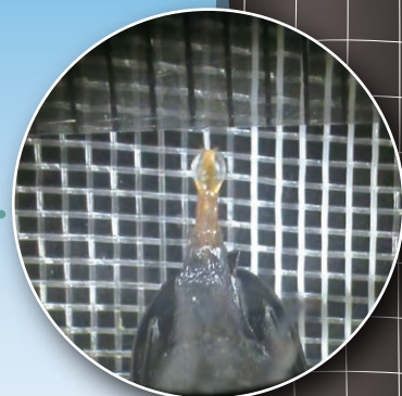
産卵管侵入抑制のネット