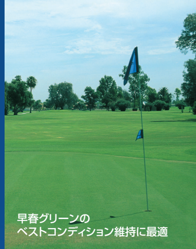
早春グリーンの ベストコンディション維持に最適