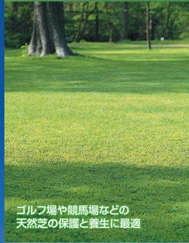
ゴルフ場や競馬場などの 天然芝の保護と養生に最適